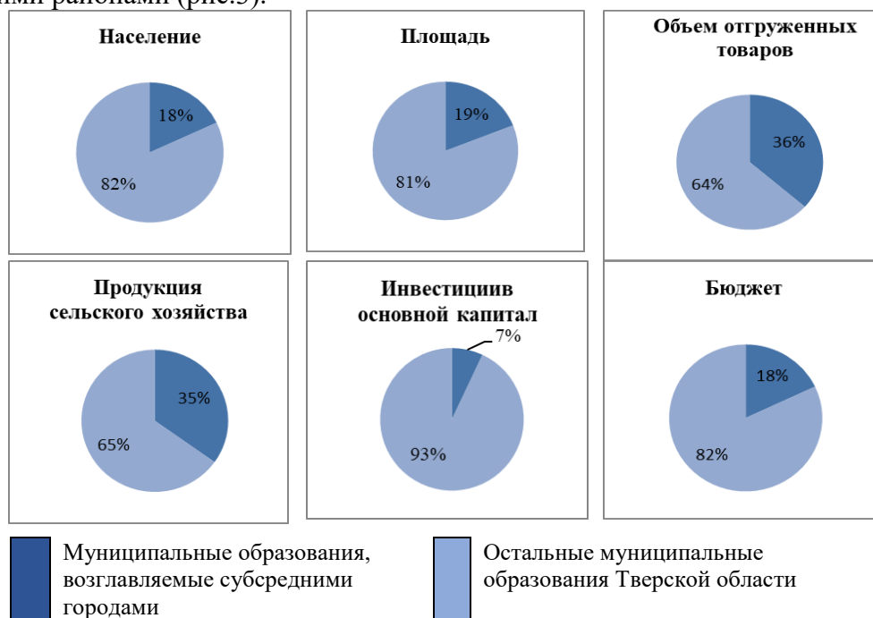
Р и с. 3. Доля муниципальных образований, возглавляемых субсредними городами, по основным социально-экономическим показателям Тверской области

Все города имеют разные административные статусы, например, Удомля, Нелидово и Осташков являются городскими округами в границах бывших одноименных муниципальных районов, а Конаково, Бежецк и Бологое остаются городскими поселениями. В силу этих особенностей показатели для субсредних городов, которые находятся в статусе городских поселений, рассмотрены вместе с возглавляемыми ими районами (рис.3).