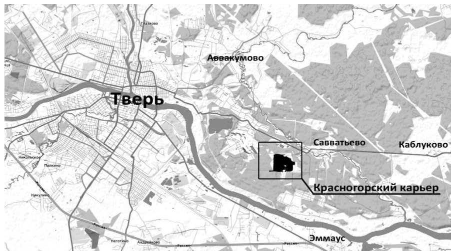
Рис. 1. Физико-географическое положение Красногорского карьера

Красногорский песчаный карьер располагается на территории Каблуковского сельского поселения Калининского района Тверской области. Карьер находится в нескольких километрах от границы г. Тверь (рис. 1). Красногорский песчаный карьер является обособленным подразделением Тверского комбината строительных материалов № 2, он является основным источником песчаного материала – сырья для производства силикатного кирпича.