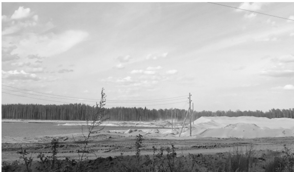
Рис. 2. Территория Красногорского карьера

В настоящее время карьер достаточно активно разрабатывается. Хозяйственная деятельность, связанная с добычей песка, приводит к трансформации природной среды (рис. 2). Изменениям подвержены и прилегающие к карьеру территории, на которых хозяйственная деятельность не ведется. В первую очередь воздействие на близлежащие природные комплексы обеспечивается за счет изменения поверхностного стока и уровня грунтовых вод. По этой причине в окрестностях карьера наблюдаются процессы деградации природных сообществ. Для оценки произошедших в природных комплексах изменений важно знать объем и динамику оказанных воздействий. Цель данного исследования оценить динамику изменения площади водной поверхности песчаного карьера с 1988 по 2021 гг.