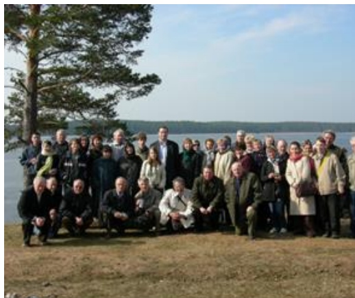
Осташков, Нилова пустынь