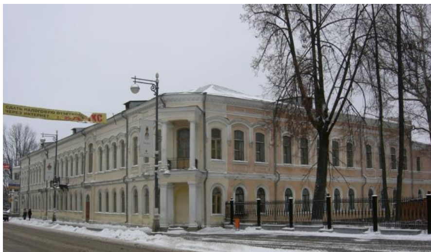
Бывшее Тверское реальное училище на улице Миллионной (ул. Советская, д.5)