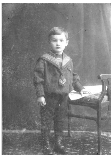
Валентин Алексеевич в детские годы