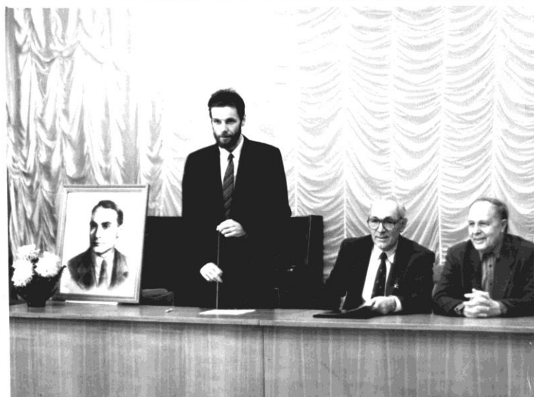
Первые Каргинские чтения, Тверь, 1994 г.

Если первые чтения носили чисто мемориальный характер, то в настоящее время они превратились в солидное научное мероприятие с международным участием.