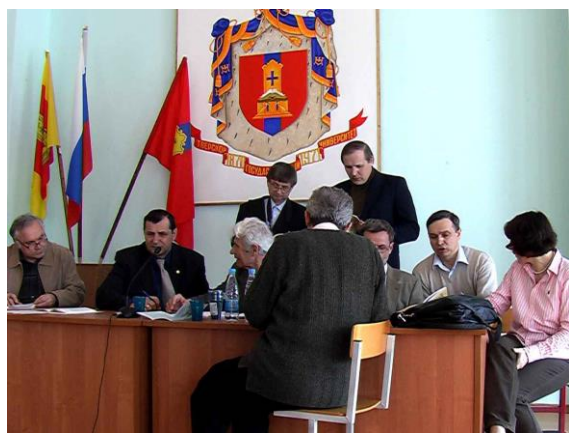
Члены оргкомитета и экспертного совета конференции молодых ученых отбирают победителей