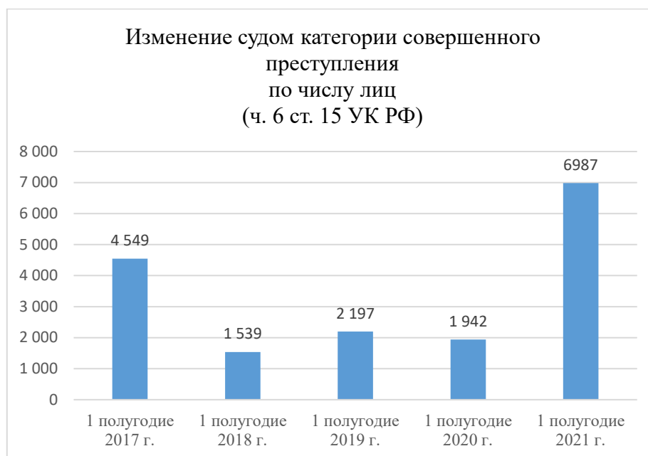
Рис. 1. Динамика изменения судом категории тяжести совершенного преступления (по числу лиц)

Приведенные данные позволяют сделать вывод о том, что после принятия постановления ПВС РФ в 2018 г. существенно снизилось количество лиц, по уголовным делам в отношении которых суды изменили категорию преступления. Основанием для этого, вероятно, явилась определенная дополнительная формализация Пленумом условий применения ч. 6 ст. 15 УК РФ. Вместе с тем, в 2021 г. отмечается существенный рост количества таких лиц с 1 942 за первое полугодие 2020 г. до 6 987 за аналогичный период 2021 г. Анализ по видам преступлений позволяет однозначно утверждать, что произошедший скачок практически в полной мере обусловлен применением ч. 6 ст. 15 УК по уголовным делам о кражах. За первое полугодие 2020 г. суды изменили категорию преступления на менее тяжкую в отношении 954 лиц, совершивших кражи, а за аналогичный период 2021 г. – в отношении 4 758, т. е. произошло увеличение почти в пять раз. Этот факт можно констатировать, однако, четко определить его возможные причины на сегодняшний день достаточно сложно.