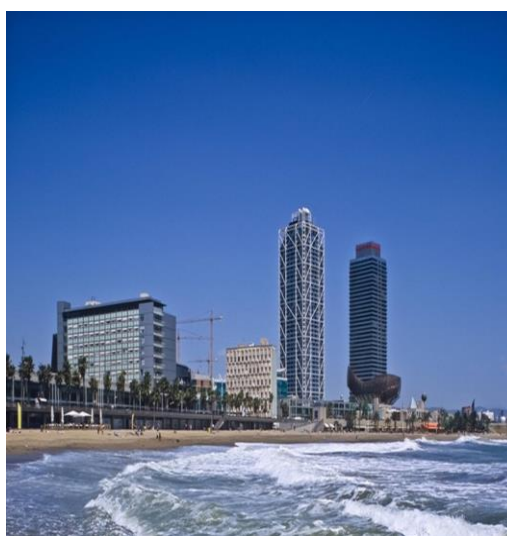
Барселона, Олимпийская деревня в Поблену (1992)