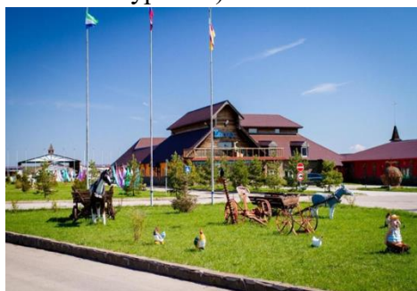
Гостиница Вахромеево (Конаковский район, с. Вахромеево)

2. Трансформация функций и пространства существующих городов (внутренние процессы формирования городского пространства под влиянием туризма).