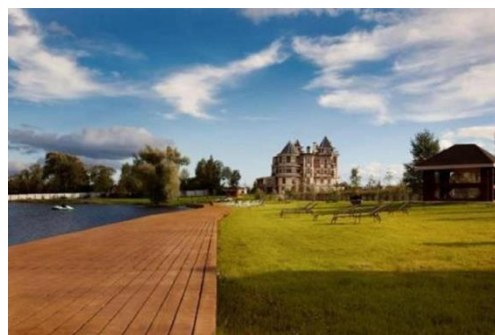
Загородный отель Конаков (Конаковский район, д. Сажино)