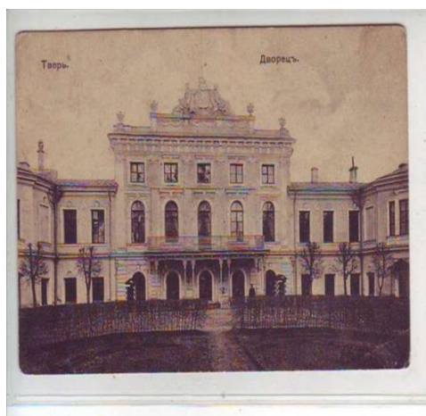
Путевой дворец в Твери (1766)