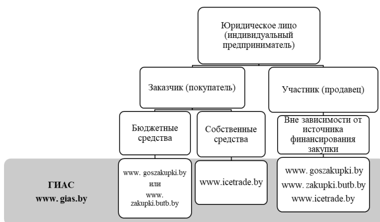
Рис. 3. Определение электронной торговой площадки для проведения закупки в Республике Беларусь

До начала проведения процедуры закупки необходимо определить, действительно ли закупка будет являться государственной, и с какой электронной торговой площадкой (ЭТП) необходимо работать (рис.3).