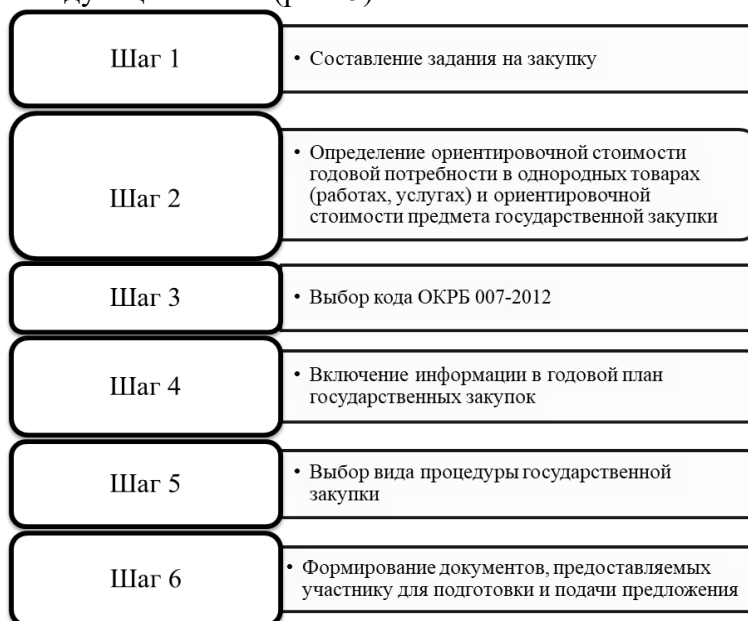
Рис. 5. Действия при подготовке к проведению процедуры государственной закупки в Республике Беларусь

Примерный алгоритм действий при подготовке к проведению процедуры госзакупки согласно белорусскому законодательству включает следующие этапы (рис. 5).