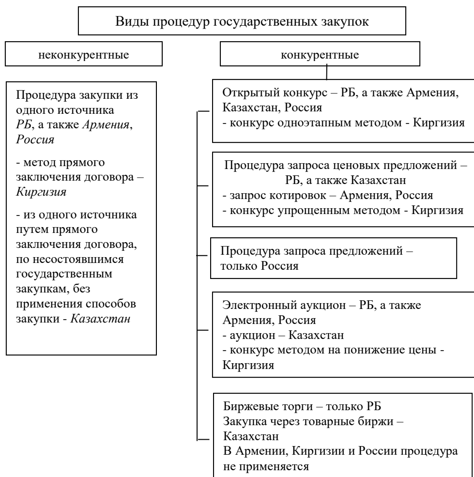
Рис. 1. Классификация процедур госзакупок

В Законе Республики Беларусь «О государственных закупках товаров (работ, услуг)» дается следующее определение: «Процедура госзакупки – регламентированная последовательность действий заказчика (организатора) и комиссии по государственным закупкам (в случае ее создания) по выбору поставщика (подрядчика, исполнителя), которая длится от принятия решения о проведении процедуры государственной закупки до заключения договора, отмены процедуры госзакупки или признания ее несостоявшейся, если иное не установлено законодательством» [1].