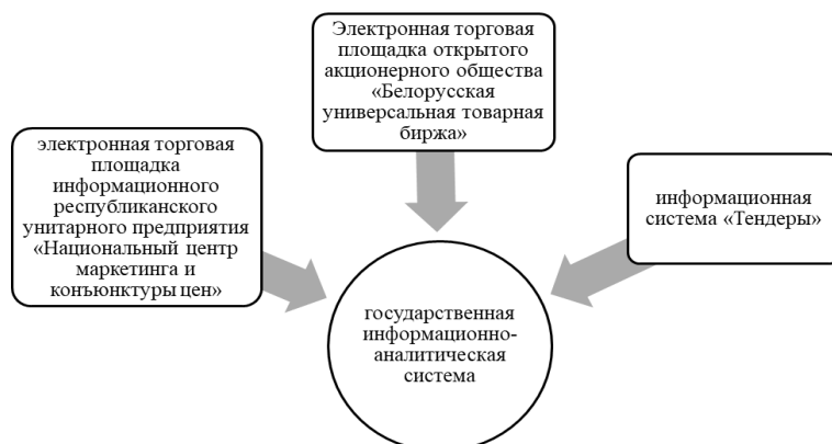
Рис. 4. Взаимодействие ГИАС с государственными информационными

государственная информационно-аналитическая система управления государственными закупками (ГИАС) (рис. 4) [3].