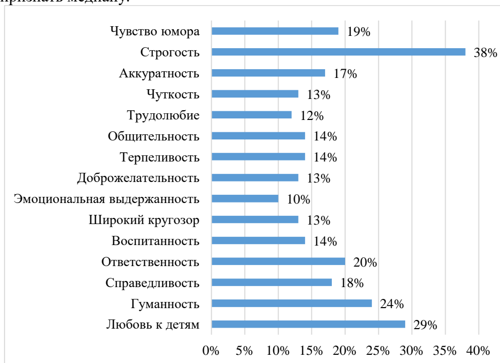
Рис. 1. Иерархия личностных качеств учителя

Качеству широкий кругозор отвели места 2, 5 и 7-е одинаковое количество человек – по 13 голосов на каждое место, и это наибольшее значение. За 3, 4, 9 и 11-е места для качества эмоциональная выдержанность проголосовали по 10 человек. По 14 человек выступили за 4-е и 7-е места для качества воспитанность . Таким образом, присвоить то или иное место этим качествам не представляется возможным простым нахождением моды, так как она неоднозначна в каждом из перечисленных случаев. Поэтому наилучшей характеристикой следует признать медиану.