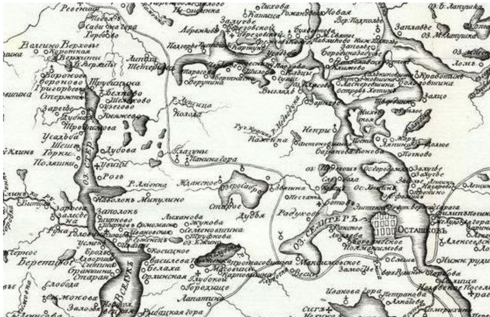
Рис. 2. Фрагмент оригинальной карты Осташковского уезда с истоком реки Волги и озером Селигер из книги Н.Я. Озерецковского «Путешествие на озеро Селигер», 1817 г. [7].

Маршрут путешествия строился из Санкт-Петербурга через Гатчину, Лугу и Старую Руссу в Осташковский уезд Тверской губернии (рис. 2) с последующим возвращением в столицу через Новгород.