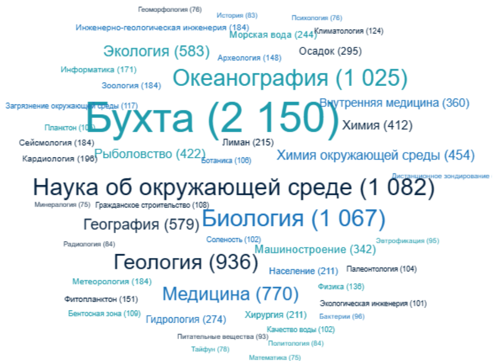
Рис.1. Междисциплинарный характер исследований Токийской СЭЗ (рисунок с экрана, программа Линза: https://www.lens.org/ )

* Справка 1 : промышленные зоны (Industrial zones) в Токийском заливе были созданы еще в эпоху Мэйдзи (1868–1912). Промышленная зона Кэйхин была построена на мелиорированных землях в префектуре Канагава к западу от Токио. После Второй мировой войны он был расширен до промышленной зоны Кэйё в префектуре Тиба вдоль северного и восточного побережья Токийского залива. Развитие этих двух зон привело к созданию крупнейшего промышленно развитого района в Японии. Крупномасштабные промышленные зоны прибрежного региона Токио вызвали значительное загрязнение воздуха и воды.