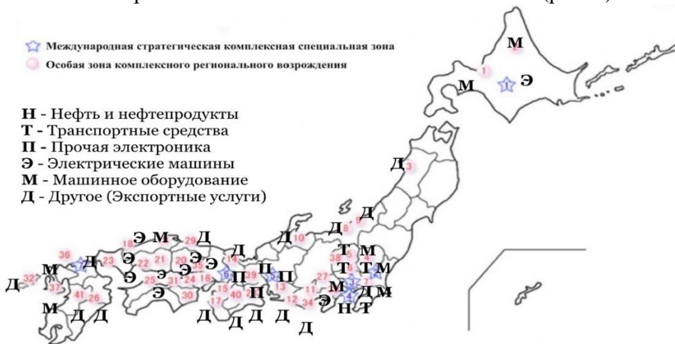
Рис. 3. Расположение ОЭЗ по регионам Японии и их основные отрасли специализации (составлено авторами на основе карты и исходной информации [9])

Рассмотрим особые экономические зоны Японии (рис. 3).