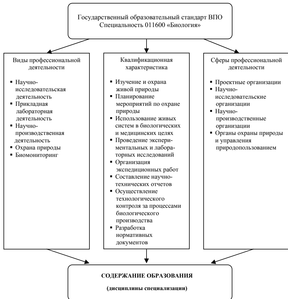
Рис. 1. Проектирование содержания образования в рамках специализации

Существующие в настоящее время специализации в рамках специальности «Биология» предметоцентричны (ботаника, зоология, анатомия и физиология человека, биохимия). Содержание обучения в их рамках нацелено на формирование аналогичных умений и навыков. В наибольшей степени они ориентируют студентов на научно-исследовательскую