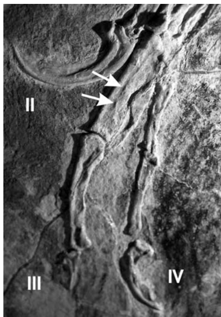
Рис. 2. Пальцы левого крыла Confuciusornis sanctus : латинскими номерами обозначены их порядковые номера, принятые в настоящей статье; стрелки указывают на бугорки, к которым, по всей видимости, крепились фолликулярные связки двух первостепенных маховых