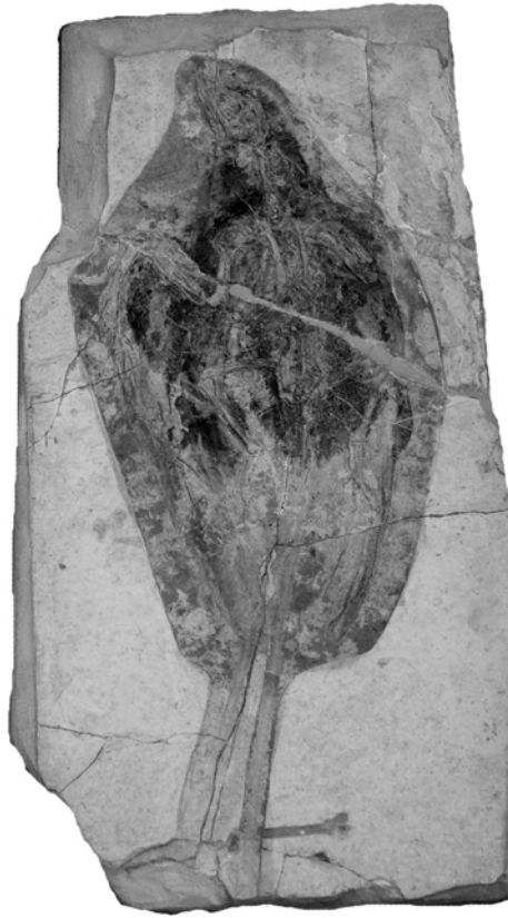
Рис. 1. Экземпляр Confuciusornis sanctus (MB.Av.1168) из Палеонтологической коллекции позвоночных Музея естественной истории университет им. Гумбольдта (Берлин).

Второй палец развернут к наблюдателю медиальной стороной. Длинная, субцилиндрическая и несколько сужающаяся дистально проксимальная фаланга несет на дистальном конце ямку для крепления коллатеральной связки (рис. 3: Ph1(II)). Крупная, серповидная когтевая фаланга несет на видимой, медиальной, стороне глубокую продольную борозду и имеет мощный флексорный отросток (рис. 3: Ph2(II)). Сохранившиеся две трети когтевого чехла (рис. 3: N(II)) указывают на превосходящие размеры этого когтя перед остальными двумя передней конечности. Хорошая, в большинстве случаев, [8; 24; 41], сохранность чехла второго пальца указывает, по-видимому, на его более мощное развитие в сравнении с роговыми чехлами третьего и четвертого пальцев. Отпечатки перьев крылышка, которое у орнитур ассоциировано со вторым пальцем, отсутствуют. Это характерно для всех конфуциусорнитид [41], а также для археоптерикса [34].