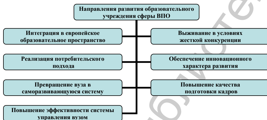
Рисунок 2. Стратегические направления развития современного вуза

Управление развитием вуза может принять форму концепции как системы взглядов, отражающей определенную точку зрения или определенный способ видения, понимания, трактовки явлений, процессов и т.п. Реализация представленной концепции может быть осуществлена посредством поступательного движения вперед по определенным направлениям, которые позволят образовательному учреждению занять свою нишу на рынке, обеспечить высокое качество образования, а значит приобрести и/или стабилизировать имеющиеся преференции в конкурентной среде. Для учреждений ВПО могут быть определены следующие приоритетные направления развития, представленные на рисунке 2.