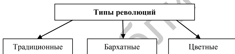
Рис. 1. Типы революций (по Г.Г. Почепцову)

Б. Капустин утверждает, что на первый план выходит «трудность и спорность идентификации исторических явлений в качестве революции» [7, с. 13]. И правда, в классическом понимании значение слова «революция» мы находим в любом толковом словаре. Мы считаем достаточным привести пример лишь одного словарного определения, так как все остальные варианты схожи по смыслу и отличаются лишь порядком слов в предложении. Так, «Большой толковый словарь русского языка» [2, с. 1110] трактует революцию как «коренной переворот во всей социально-экономической структуре общества, приводящий к смене общественного строя». Данное определение, как и все другие, взятые из словарей, не может быть применимо к именованию «ЦР». Так, в результате Оранжевой революции в Украине в 2004 году общественно-политический строй остался прежним, да и структура общества не изменилась. То же касается и других «ЦР». В связи с этим Г.Г. Почепцов выделяет три типа революций в зависимости от динамики элит и динамики социального строя [11, с. 10] (см. рис. 1).