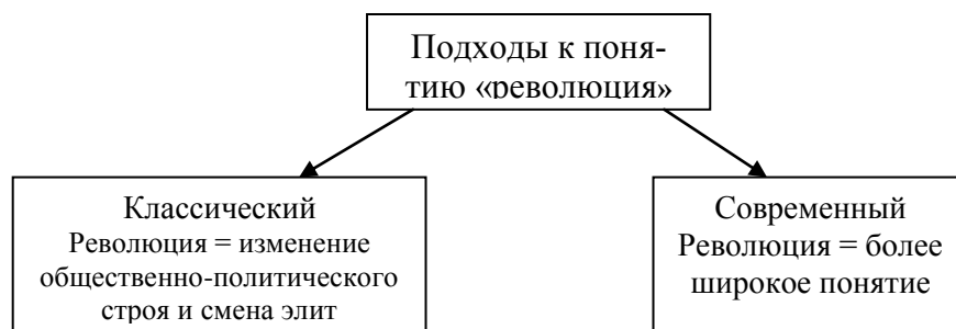
Рис. 2. Подходы к определению понятия «революция»

Например, Теда Скочпол ещё в 80-х годах XX века даёт определение революции как «быстрой трансформации государственной и классовой структур, сопровождаемой и частично проводимой с помощью классового восстания» [11, с. 10], и оно считается эталоном своего времени, несмотря на явно упрощённую структуру. Однако Джек Голдстоун признаёт определение Скочпол устаревшим из-за опоры на классовость и выдвигает своё, которое позволяет включить в свой состав и относительно мирные революции и в тоже время исключить перевороты, мятежи, гражданские войны, восстания и мирные переходы к демократии. В его понимании революция – это