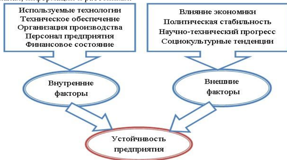
Рис.1. – Факторы, влияющие на экономическую устойчивость

технических навыков, необходимых для реализации преобразований в материалах, информации и работниках.