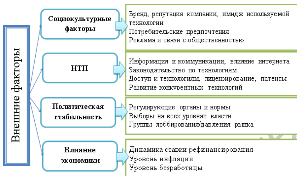
Рис.3. – Показатели, характеризующие внешние факторы

изменяться в зависимости от специфики работы выбранного предприятия, поэтому для применения методики необходимо её корректировка под конкретное предприятие. На рисунке 3 изображены показатели, характеризующие внешние факторы, а на рисунке 4 показатели, характеризующие внутренние факторы.