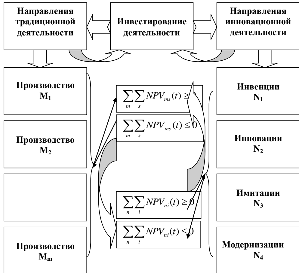
Р и с . 2. Взаимосвязь инновационного и инвестиционного циклов предприятия с учетом текущей деятельности

определяется суммарными величинами чистой текущей стоимости NPV на текущий момент времени t .