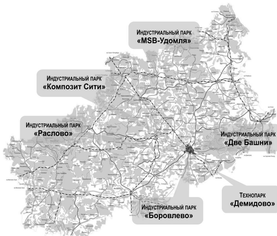
Рисунок 2 – Индустриальные парки Тверской области

В результате реализации инвестиционных проектов на территории индустриального парка создано около 3000 рабочих мест.