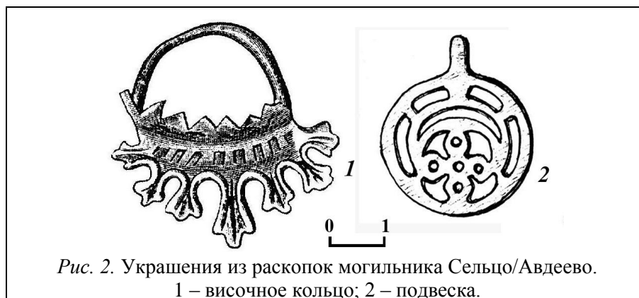
Рис. 2. Украшения из раскопок могильника Сельцо/Авдеево. 1 – височное кольцо; 2 – подвеска.

лями достаточно узкими хронологическими рамками, укладываемыми в середину – вторую половину XI в. 6