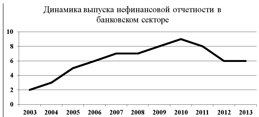
Р и с . 2. Динамика выпуска нефинансовой отчетности в банковском секторе

Из рис. 2 – видно, что самым активным годом в нефинансовой отчетности принято считать 2010 год.