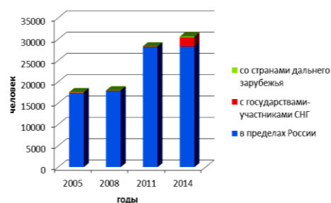
Р и с . 2 Динамика показателей миграционного оттока населения Тверской области в отдельные годы

Рисунок 1 отражает структуру миграционного притока населения Тверской области в отдельные годы. По состоянию на 1.10.2014 г. 92,3% выбывших уехали в другие регионы РФ, наибольшая часть в Московскую область. Наглядно это можно посмотреть на рис. 2, отражающем структуру миграционного оттока населения Тверской области в отдельные годы.