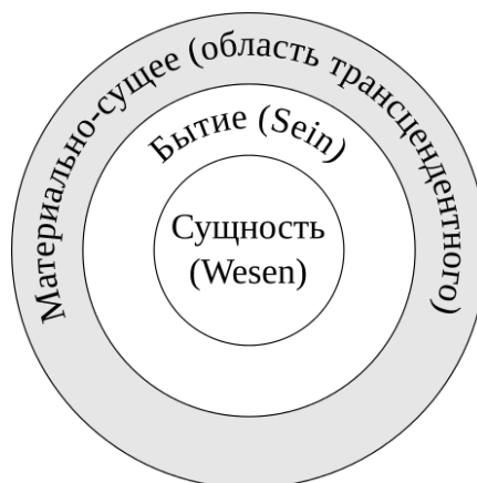
Рис. 1. Базовая модель регионов сущего

Категория «сущность». Под сущностью мы будем традиционно понимать умопостигаемый мир понятий и идей. Это и строгий мир математических аксиом, которые не зависят от нашего настроения и самочувствия, и хаотичный мир понятий с их переменными смыслами, зависящими от текучего бытия, и блистательный мир духовных истин, вечно искомым и всегда теряющих свою чистоту при соприкосновении с бытийным хаосом. Это тот удивительный регион, в котором находили прибежище Парменид и Платон, и в то же время привольно чувствовали себя Протагор и Гераклит. Неоднородность этого региона и послужила поводом для поисков дальнейшей дифференциации триединой соловьёвской модели.