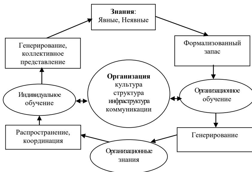
Р и с . 1 . Схема взаимосвязи знаний, обучения и ключевой компетенции организации [4, с. 445]

Применительно к реальному сектору экономики, данный процесс представляется в виде генерирования компаниями знаний, их накопления и использования с целью достижения конкурентных преимуществ и увеличения своей капитализации.