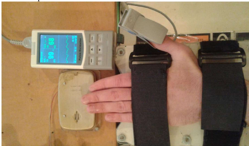
Р и с . 1 . Экспериментальная установка для исследований произвольной ритмической активности пальцев руки (теппинг), с синхронной пульсотонометрической регистрацией функций сердечно-сосудистой системы (оксигенация крови, частота сердечных сокращений, фотоплетизмограмма)

Методика. В экспериментальных исследованиях в качестве испытуемых участвовали мужчины 18-24 лет (N=12) без хронических и острых заболеваний нервной и нервно-мышечной систем. Опыты проводились за 1,5-2 часа до приёма пищи при референтных величинах температуры помещения, атмосферного давления, шумового и светового режимов.