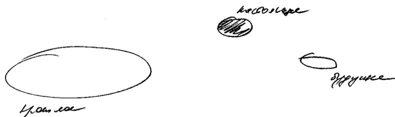
Рис. 2. Типичный рисунок временной перспективы представителя группы неработающих лиц «третьего возраста».

Рис. 2 подтверждает и уточняет результаты теста Ф. Зимбардо. У неработающих лиц «третьего возраста» полностью отсутствует связанность временных зон; они живут прошлым и при этом прошлое для них негативно. Настоящее не радостно и – более того – тревожно (штриховка на рисунке). Будущее неопределенно.