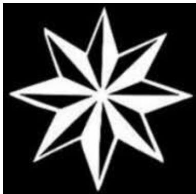
Фото 1 [4]