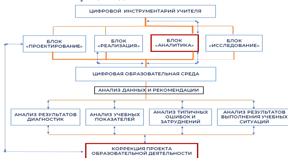
Рис. 3. Дидактическая модель взаимодействия цифрового инструментария и цифровой образовательной среды при анализе данных об образовательном процессе

Цифровая образовательная среда в контексте реализации данного дидактического блока предполагает наличие следующих информационных модулей: анализ и визуализация результатов диагностики педагогической технологии; анализ и визуализация результатов всех диагностик в контексте с результатами промежуточной и итоговой аттестации; анализ возможных затруднений, фиксация типичных ошибок, разработка персонифицированной системы коррекционной работы для обучающихся данного класса; анализ и визуализация результатов прохождения обучающимися учебных ситуаций и освоения соответствующих видов опыта.