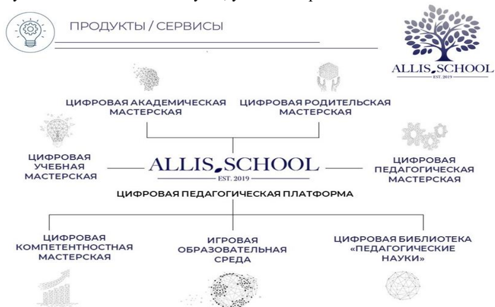
Рис. 5. Номенклатура сервисов цифровой образовательной среды

Заявленная цифровая педагогическая платформа ориентирована на: развитие научно-обоснованного педагогического инструментария учителя/преподавателя для организации современного учебного процесса; проектирование и обеспечение индивидуальных образовательных траекторий обучающихся; разработку сервиса по созданию педагогических тренажеров и симуляторов для учеников, студентов педагогических вузов, учителей/преподавателей.