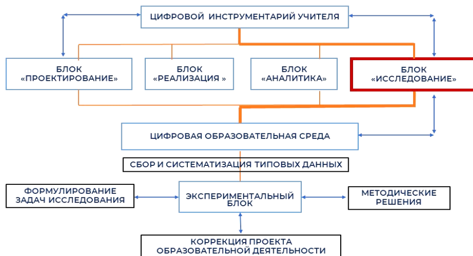
Рис. 4. Дидактическая модель взаимодействия цифрового инструментария и цифровой образовательной среды при исследовательской деятельности учителя

Это детерминирует определенные требования к проектируемой цифровой образовательной среде образовательной организации, которая должна содержать в себе информационные банки и цифровой дидактический инструментарий, необходимый и достаточный для проведения научного исследования, педагогических экспериментов, интерпретации их результатов для дальнейшей корректировки спроектированного и реализованного проекта образовательной деятельности.