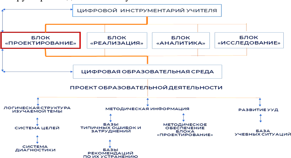
Рис. 1. Дидактическая модель взаимодействия цифрового инструментария и цифровой образовательной среды при проектировочной и конструкторской деятельности учителя

На рис. 1 представлена дидактическая модель взаимодействия цифрового дидактического инструментария и цифровой образовательной среды в контексте проектировочной и конструкторской деятельности учителя.