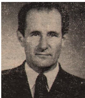
Гречка Петр Васильевич (1925–2001) 1

куда собиралась молодежь города (факультет располагался в центральном корпусе – на ул. Желябова).