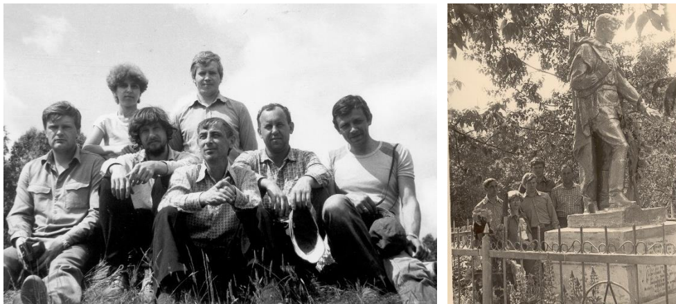
Р и с. 2. Сотрудники НИИ 2 МО СССР, 1982 г., Ржевский район

чтобы около 400 пропавших без вести воинов были признаны погибшими (40 в Калининне, более 200 – в Ржевском районе).