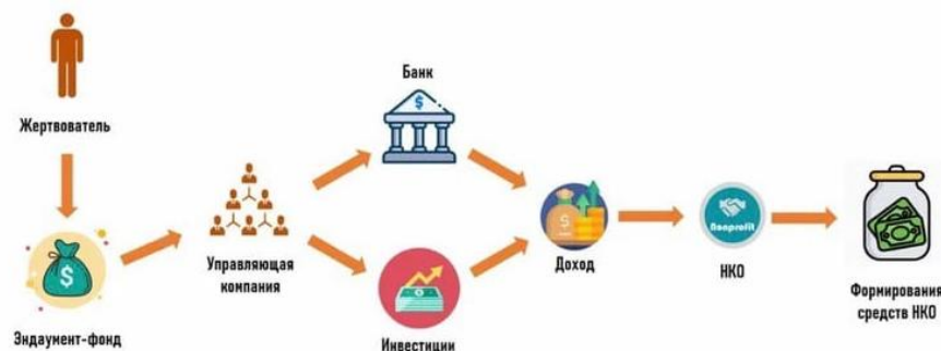
Р и с . 2. Схема функционирования фонда целевого капитала в системе образования

Противоречивым явлением с точки зрения государственно-частного партнёрства в образовании являются фонды целевого капитала, способствующие диверсификации источников внебюджетного финансирования деятельности. Российский экономист Я.М. Миркин считает, что фонды целевого капитала выступают механизмом государственно-частного партнёрства, если один из участников является государственным учреждением [10, с.42]. В Федеральном законе от 30 декабря 2006 года № 275-ФЗ «О порядке формирования и использования целевого капитала некоммерческих организаций» ст. 3 п. 1 гласит, что целевой капитал может быть сформирован и далее использован в системе образования [1]. Больше половины фондов целевого капитала в России функционирует в области образования. На рис. 2 представлена схема функционирования фонда целевого капитала в системе образования. В 2020 г. рост фондов целевого капитала вырос рекордными за последние пять лет темпами почти на четверть с сохранением тренда в 2021 году. Целевой капитал формируется за счёт пожертвований и специальных целевых взносов, которые в свою очередь инвестируются и приносят доход. Однако существуют проблемы, связанные с привлечением пожертвований от юридических лиц: 1) отсутствие стимулов и льгот для доноров; 2) крупные компании во избежание репутационных рисков предпочитают прямые договоры пожертвований, а по законодательству собственники целевых капиталов не могут самостоятельно их инвестировать – средства необходимо передать в доверительное управление.