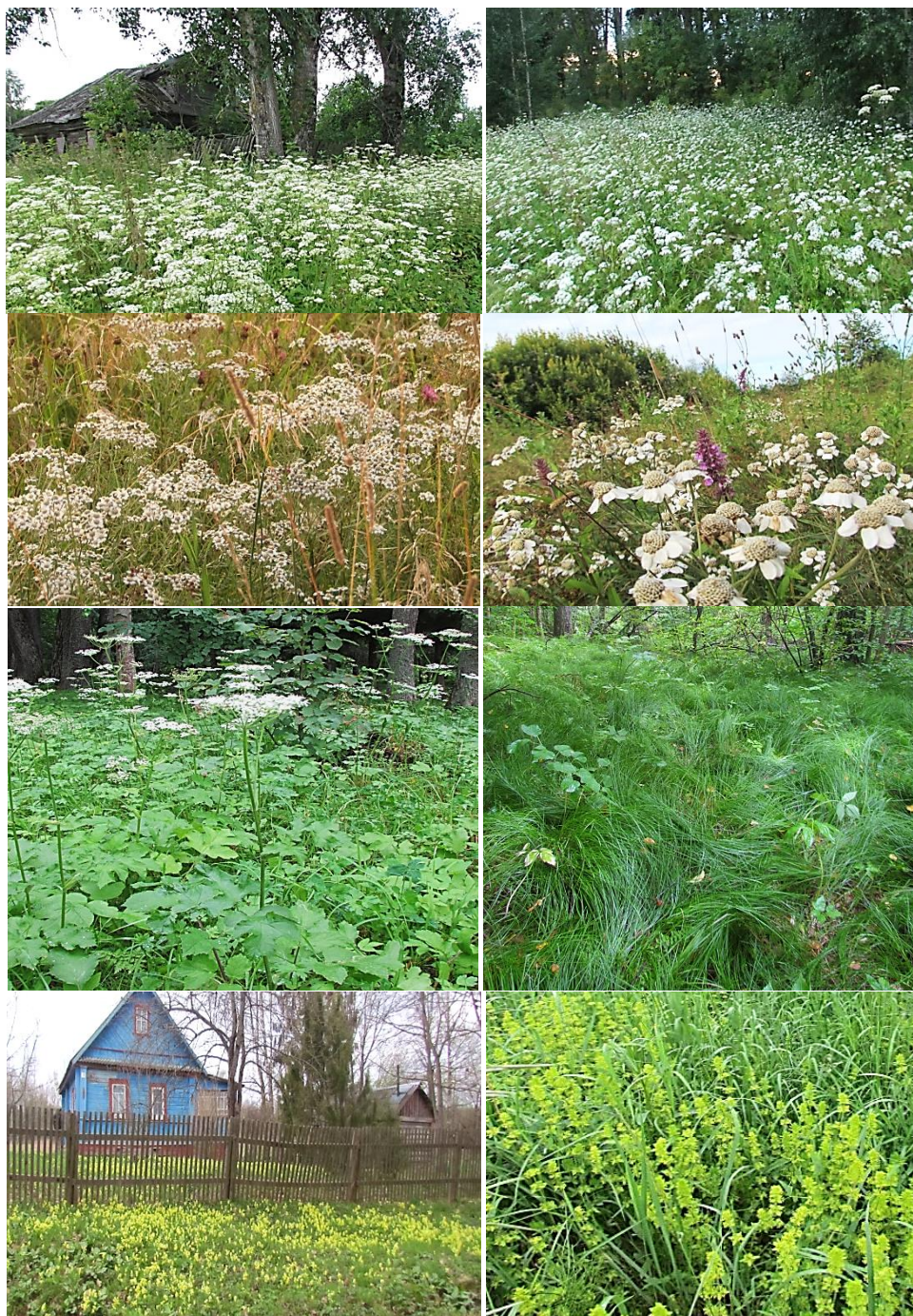
Рис. 2. Фитоценозы со значительным участием некоторых полемохов: Pimpinella major в дер. Ровное и около дер. Ревякино, 2019 г. (1-й ряд), Ptarmica vulgaris в окрестностях дер. Новое и Папино, 2019 г. (2-й ряд), Heracleum phondylium и Carex brizoides в дер. Бобровка, 2020 г. (3-й ряд), Primula elatior (дер. Бобровка) и Cruciata laevipes (ст. Рождествено), 2021 г. (4-й ряд), фото В.А. Нотова