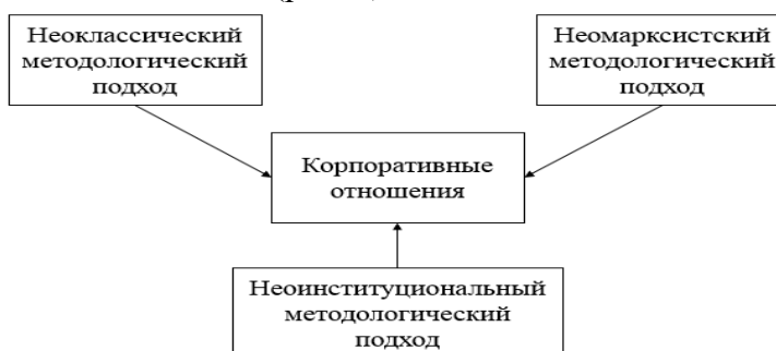
Рис. 1. Методологические подходы исследования сущности корпоративных отношений

В настоящее время идет перестройка сложившейся системы экономических связей и экономических отношений, определяемая модификацией отношений собственности. Более ранние исследования, основанные на выделенных методологических подходах, подвели нас к пониманию основных изменений в развитии современных корпоративных отношений (рис. 1).