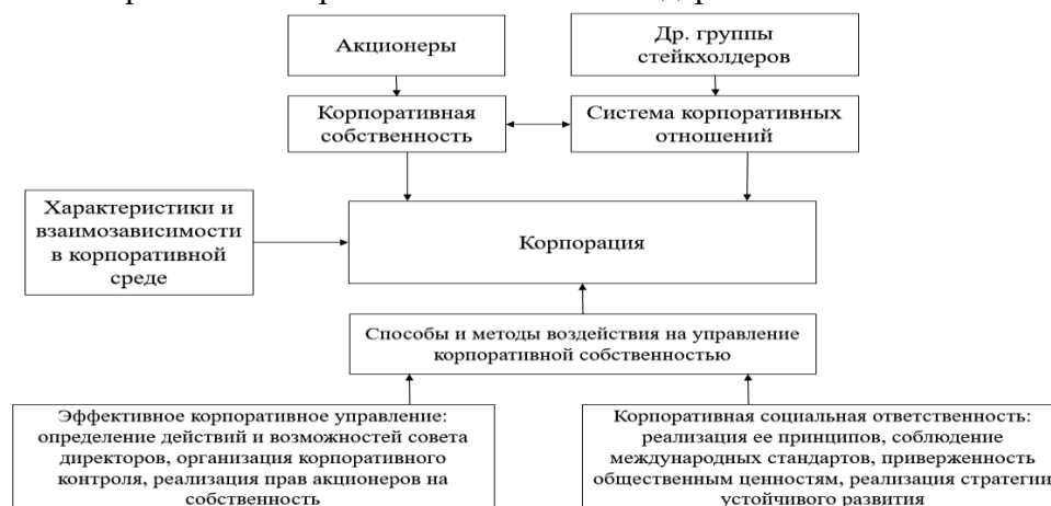
Рис. 3. Воздействие стейкхолдеров на корпорацию: влияние корпоративного управления и КСО

Развитие связи этических ценностей и устойчивого развития вывели взаимодействие со стейкхолдерами на новый уровень – требования к корпорациям реализовать на практике этическое лидерство, которое возможно только при четком видении и учете в своей стратегии интересов и забот стейкхолдеров.