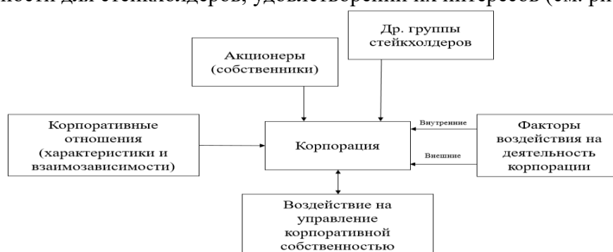
Рис. 2. Взаимодействия и взаимосвязи корпорации и стейкхолдеров

Корпорация сталкивается с многочисленными представителями определенных групп интересов, и оценка деятельности корпорации отходит от рациональности действий и, казалось бы, объективной оценки эффективности использования предоставленных ресурсов. Оценка все более тяготеет к субъективной позиции действующих оппонентов корпорации – стейкхолдеров. И речь начинает идти о ценности для стейкхолдеров, удовлетворении их интересов (см. рис. 2).