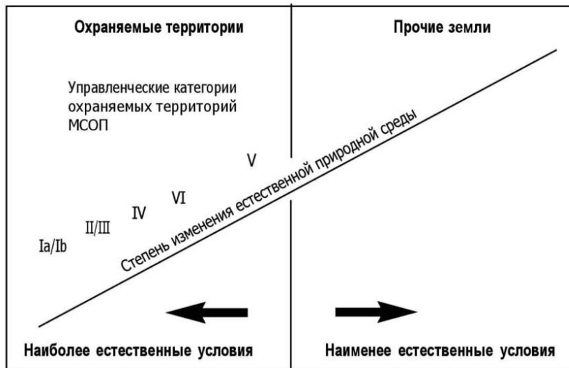
Рис. 1. Соотношение управленческих категорий МОСП и степени изменения естественной природной среды [1]

Соотношение управленческих категорий МОСП и степени изменения естественных ландшафтов хорошо иллюстрирует рис. 1.