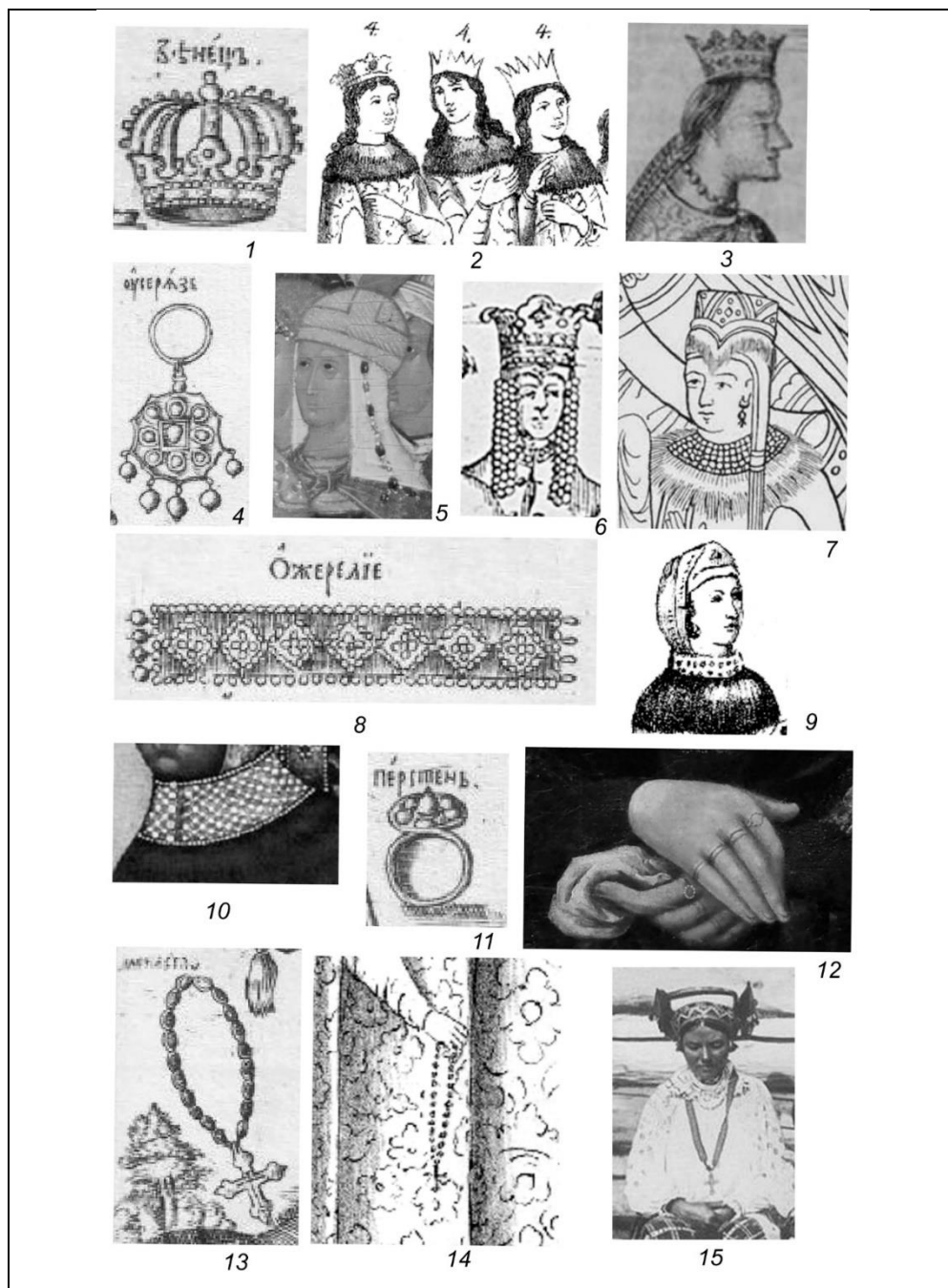
Рис 2. Украшения женского ювелирного убора в изобразительных источниках XVI–XVII вв.

1, 4, 8, 11, 13 – изображения украшений из «Букваря» Кариона Истомина, 1694 г. (Букварь: отпечат. в 1694 г. в Москве / Сост. Карионом Истоминым; гравир. Леонтием Буниным. Л., 1981); 2 – сестры царские в венцах, фрагмент рисунка из альбома А. Мейерберга (Альбом Мейерберга. Виды и бытовые картины России XVII века. СПб., 1903. Л. 40); 3 – царевна Софья в венце, фрагмент иллюстрации из книги, 1693 г. (Ровинский Д.А. Материалы для русской иконографии. СПб., 1884. Вып. 1. Ил. 5);