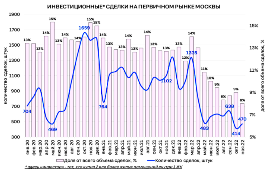
Рис. 2. Динамика инвестиционных сделок на первичном рынке Москвы в период с января 2020 по ноябрь 2022 гг. [5]

Подводя итог, текущую ситуацию на рынке жилой недвижимости вполне можно описать таким термином как «повышенная волатильность». Кроме уже подробно рассмотренных выше, к основным проблемам рынка жилой недвижимости, как в России в целом, так в Московском регионе, можно отнести следующее: