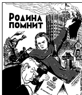
Рис. 18. Г. Дритов. Родина помнит 52

Оппозиционные дискурсы 1990-х активно использовали образ униженной России-Матери. На одном из рисунков разгневанная Родина указывает перепуганному Б. Ельцину на пылающее здание Верховного Совета РСФСР (рис. 18).