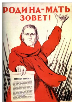
Рис. 12. И. Тоидзе. Родина-мать зовет!

Начало Великой Отечественной войны ознаменовалось появлением одного из самых известных образов Родины-матери: плакат И. Тоидзе стал символом своего времени (рис. 12). Русская женщина, изображенная на нем, воплощает не только страдания родной земли или её силу, но и призыв к чувству долга советского воина. Обратим внимание на то, что в её правой руке – текст воинской присяги, в которой сказано о суровой каре для тех, кто нарушает клятву защищать свою Советскую Родину. Иными словами, Родина-мать в данном случае отделяет настоящих детей от предателей. Этот женский образ значительно отличается от образов современниц с плакатов предвоенной поры, что связано, скорее всего, с тем, что автор стремился показать не классовый, а национальный характер мобилизации, используя символический капитал аналогичных сюжетов графики дореволюционной России 44 .