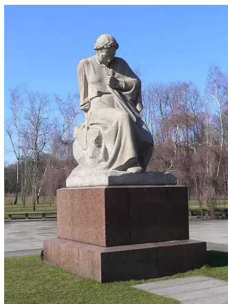
Рис. 14. Е. Вучетич. Скорбящая Родина

значение для советской пропаганды. Риторический характер вопроса «Хотят ли русские войны?» в немалой степени обеспечивался образом матери, потерявшей сына. Пожалуй, в каждом населенном пункте СССР был установлен мемориал павшим в Великой Отечественной войне воинам; чаще всего горе народа символизировала фигура скорбящей матери, как, например, «Скорбящая Родина» (Е. Вучетич, 1946) в берлинском Трептов-парке (рис. 14) или «Мать-Родина» на Пискаревском кладбище в Ленинграде (В. Исаева и др., 1960).