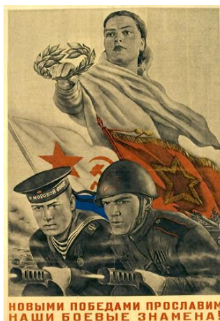
Рис. 13. В. Корецкий Новыми победами прославим наши боевые знамена!

стремлению мужчины защитить честь и жизнь дорогих ему женщин взывали и другие известные работы, посвященные теме страданий советских женщин 46 . Эта тема отражена и в кинокартинах, вышедших в прокат в годы войны – прежде всего в фильмах «Она защищает Родину» (М. Эрмлер, 1943), «Радуга» (М. Донской, 1943) 47 . Еще один аспект темы Родины-Матери – мать, защищающая свое дитя, – получил яркое воплощение в произведении В. Корецкого «Воин Красной Армии, спаси!» (1943) 48 .