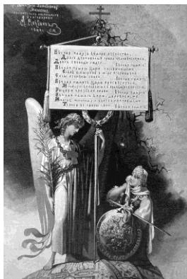
Рис. 3. М. Микешин. Плачущая Россия 17

родом 15 . Как безутешная вдова выглядит женщина на рисунке «Плачущая Россия», созданном в 1894 г. в память о гибели Александра II (рис. 3) 16 .