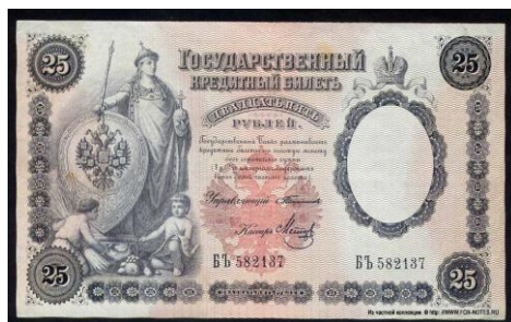
Рис. 4. Государственный кредитный билет 25 рублей 20

Последняя четверть XIX в. знаменательна для исследуемого вопроса тем, что женская аллегория России становится элементом повседневности, «банального национализма», по выражению М. Биллига 18 . Особенно примечательным в этом плане стало помещение её изображения на банкноты. Так, на государственном кредитном билете достоинством 25 рублей 1899 г. выпуска изображена женщина в княжеской одежде и шапке Мономаха; она держит скипетр и державу, опираясь на древнерусский щит (рис. 4). Образы России украсили и банкноты достоинством 5 и 10 рублей выпуска 1894–1895 гг., а также купюру в 500 рублей выпуска 1912 г. 19