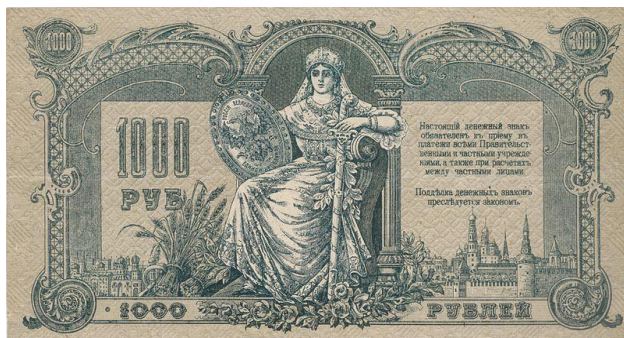
Рис. 11. 1000 рублей, Донское правительство 40

В силу своей полисемантичности «Россия–Матушка» была одним из немногих символов, объединяющих столь разнородное в политическом отношении явление, как Белое движение. О его востребованности свидетельствует и то, что он активно привлекается для дизайна банкнот: мы видим его на «донских» денежных знаках, билетах Главного командования Вооруженных сил Юга России, казначейских знаках Сибирского Временного Правительства атамана Семенова (рис. 11) 39 .