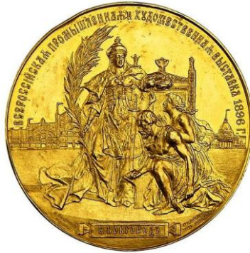
Рис. 5 Медаль «Всероссийская промышленная и художественная выставка в Нижнем Новгороде – 1896 год» 22

Россия в женском облике появляется на медалях, календарях, рекламных плакатах, в интерьерах городских усадеб (рис. 5); так, интересным примером превращения символа в элемент городского пейзажа выступает скульптурная композиция «Россия со щитом» (1912, М. Харламов), помещённая на крыше здания правления страхового общества «Россия» в центре Петербурга, на Большой Морской 21 . Одним же из наиболее известных случаев визуализации России этого периода стала скульптура «Россия», выполненная в технике каслинского литья по модели Н. Лаврецкого для Всероссийской художественно-промышленной выставки в Нижнем Новгороде в 1896 г. (рис. 6).