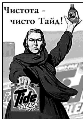
Рис. 17. Чистота – чисто Тайд

(1993): нарисованная там молодая девушка одета лишь в традиционный для исследуемого образа кокошник с надписью «Россия» и кокетливо наброшенный на обнажённое тело российский триколор... 51 .