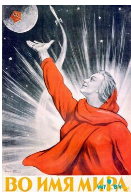
Рис. 15. И. Тоидзе. Во имя мира

Образ Родины-матери использован на плакате И. Тоидзе, выпущенном в 1959 г., в связи с достижением советским космическим аппаратом поверхности Луны (рис. 15). Столь важное для советской идеологии положение о том, что СССР является самым миролюбивым государством, вся политика которого продиктована заботой о мире, предполагало использование узнаваемого материнского символа страны.