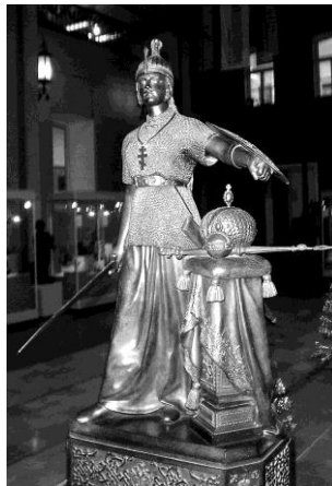
Рис. 6. Н. Лаврецкий. Россия (Екатеринбургский музей изобразительных искусств).