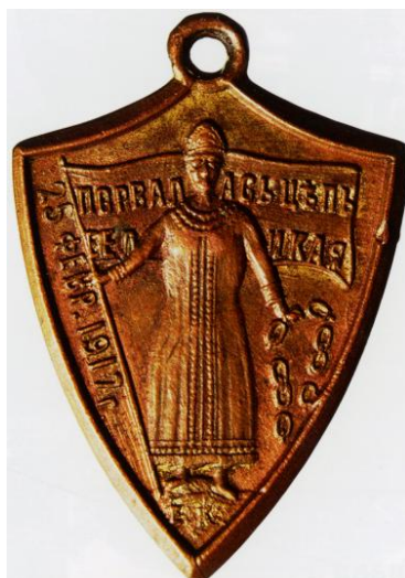
Рис. 9. Порвалась цепь великая

Вместе с тем образ России-Матушки становится элементом символической системы противников свержения самодержавия. Об оценке Февральской революции в монархических кругах в апреле 1917 г. можно судить по строкам поэта Сергея Бехтеева: «Да будут прокляты потомством // Сыны, дерзнувшие предать // С таким преступным вероломством // Свою беспомощную Мать!» 36 . В период Октябрьской революции и Гражданской войны схожий мотив включается в визуальную пропаганду сторонников Белого движения, интерпретировавшую борьбу с большевиками в качестве сражения с «угнетателями России-Матушки», «наемниками Кайзера», «палачами». Примером ожжет служить плакат «В жертву Интернационалу», на котором Россия представлена в образе связанной женщины в окружении группы большевистских лидеров (рис. 10) 37 . Белое же воинство позиционирует себя как избавителя России-Матушки. Мотив освобождения Родины занимает заметное место в риторике его лидеров: от атамана Дутова до генерала Врангеля 38 . В «Клятве добровольца» цель Белого движения была обозначена как «защищать и освободить измученную и истерзанную нашу Родину». Одна из мобилизационных листовок 1919 г. сопровождается изображением воина, который разрушает оковы молодой женщины («Доб-