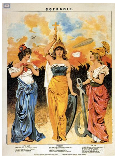
Рис. 8. Согласие (Российская национальная библиотека).