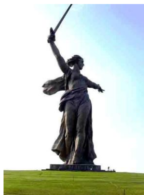
Рис. 16. Е. Вучетич и др. Родина-мать зовет!