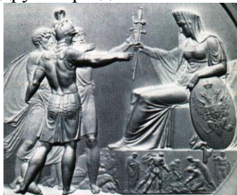
Рис. 2. Ф. Толстой. Народное ополчение. Фрагмент 13

Появление визуального образа России в собственно материнской ипостаси, вероятно, связано с медалью «Народное ополчение» (1816), созданной Ф. Толстым в числе других медальонов, посвященных событиям Отечественной войны 1812 г. В пояснении к изображению сам автор сообщает следующее: «Россия, облеченная в одежду жены Россиянки, возбуждённая гласом царя своего, сидит на возвышенном месте. В очах её блистает любовь к отечеству. Взор её помрачен печалью, но спокоен надеждою на Бога и на мужество сынов своих. Одною рукою опершись на щит, изображающий Государственный герб, другую раздаёт она мечи народу» (рис 2). 12