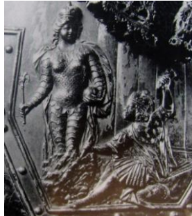
Рис. 1. Б.-К. Растрелли. Бюст Петра I. Фрагмент 7

скипетром в руках, короной на голове и мантией на плечах 4 . При этом необходимо подчеркнуть, что сам Петр выступил автором сюжета; страна создается правителем, мужское начало придает форму, душу, началу женскому – образ, восходящий к античному мифу о Пигмалионе и Галатее (который был хорошо известен царю). С одной стороны, в данном случае едва ли можно говорить о материнстве России: скорее, она сама является порождением правителя. Г. Бужинский на смерть Петра писал: «... не сын он тебе, Россия, но отец – по стольким трудам, по стольким за тебя помыслам, по стольким за твою славу подвигам, по стольким походам, победам, сражениям» 5 . С другой стороны, само появление России в женском облике не могло не напоминать современникам о Родине-матери. Тот же Бужинский, рассуждая в одной из проповедей времен Северной войны о патриотизме, гневно обличает тех, кто отказывается служить России, проводя параллель с долгом перед матерью: человек не может не быть «благодарен земле, яко родившей его матери». Ведь «отечество есть то общая нас всех мати». И даже сам царь Петр в этом смысле не свободен от сыновнего долга 6 .