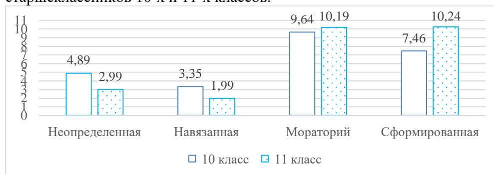
Рис. 1. Сравнительная диаграмма статусов профессиональной идентичности старшеклассников 10-х и 11-х классов (средние значения)

В своем исследовании А.А. Азбель описала этапы формирования профессиональной идентичности. Первый этап – «неопределенное состояние профессиональной идентичности», когда старшекласснику не ясно, какую профессию он хочет выбрать, он не задумывается о своем профессиональном будущем. Второй этап – «навязанная профессиональная идентичность»: старшеклассник уже определился с будущей профессией, но выбор был сделан под влиянием внешних обстоятельств или из подражания референтной группе. Третьим наступает «кризисное состояние моратория профессиональной идентичности», при котором старшеклассник начинает анализировать свой жизненный опыт и рассматривать различные варианты профессионального развития для преодоления кризиса. Наконец, четвертый этап – достижение статуса «сформированной профессиональной идентичности», который характеризуется ясным осознанием своих будущих профессиональных планов старшеклассником и самостоятельностью профессионального выбора [12]. Таким образом, анализ результатов по методике изучения статусов профессиональной идентичности А.А. Азбель и А.Г. Грецова позволяет оценить степень сформированности у старшеклассников готовности к профессиональному выбору. На рис. 1 представлены сравнительные результаты статусов профессиональной идентичности у старшеклассников 10-х и 11-х классов.