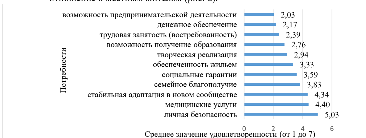
Рис. 1. Распределение наиболее значимых потребностей беженцев из зоны боевых действий как показателей качества жизни

максимально удовлетворен качеством жизни по определенному параметру) степень значимости и оценки качества жизни как удовлетворенности определенных потребностей (рис. 1), а также общее отношение к местным жителям (рис. 2).