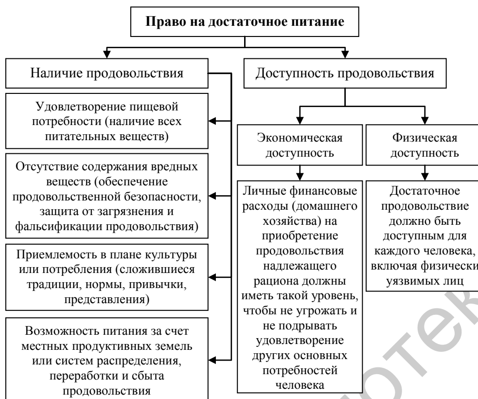
Р и с . 2. Основное содержание права на достаточное питание

Целью Конвенции выступает содействие обеспечению мировой продовольственной безопасности и улучшение способности международного сообщества реагировать на критические ситуации с продовольствием и другие продовольственные потребности развивающихся стран [9]. Продовольственная помощь предоставляется в минимальных годовых объемах и оказывается в физическом виде или ее денежном эквиваленте. Предоставляемые продукты питания должны отвечать международным стандартам качества, соответствовать диетическим традициям и продовольственным потребностям стран-получателей и быть пригодными для употребления.