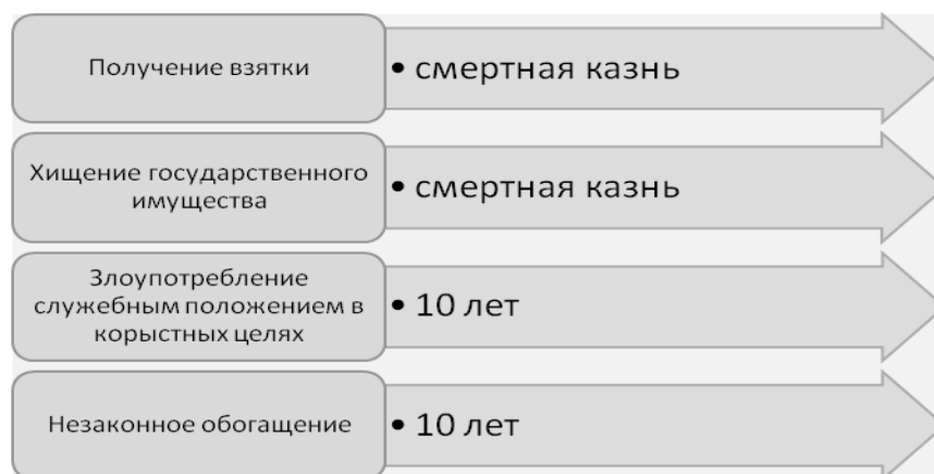
Рис. 1. Максимальные меры наказания за коррупционные преступления

В июле 2011 года сообщалось о приведении в исполнение двух смертных приговоров бывшим вице-мэрам городов Ханчжоу и Сучжоу Сюй Майюну и Цзяну Жэньцзе [25]. Однако в нашумевших делах бывшего министра железных дорог Китая Лю Чжицзюня и бывшего мэра крупного южного г. Шэньчжэня Сюй Цзунхэна были вынесены именно приговоры к смертной казни с отсрочкой исполнения приговора на два года.