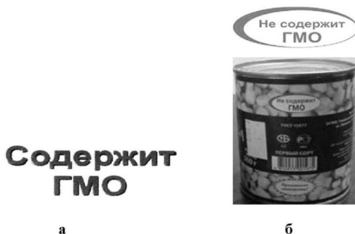
Рис. 2. Примеры обязательной и добровольной маркировки продуктов в Республике Беларусь

Согласно ст. 10 Закона Республики Беларусь «О качестве и безопасности продовольственного сырья и пищевых продуктов для жизни и здоровья человека» (Закон..., 2002), информация о наличии ГМИ в товарах должна указываться в сопровождающих документах и на упаковке (таре), а также на этикетке. Это должна быть надпись крупным шрифтом красного цвета «Содержит ГМО» (рис. 2а).