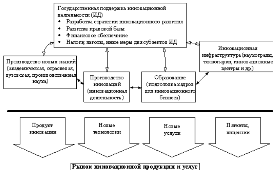
Рис.1. Схема национальной инновационной системы