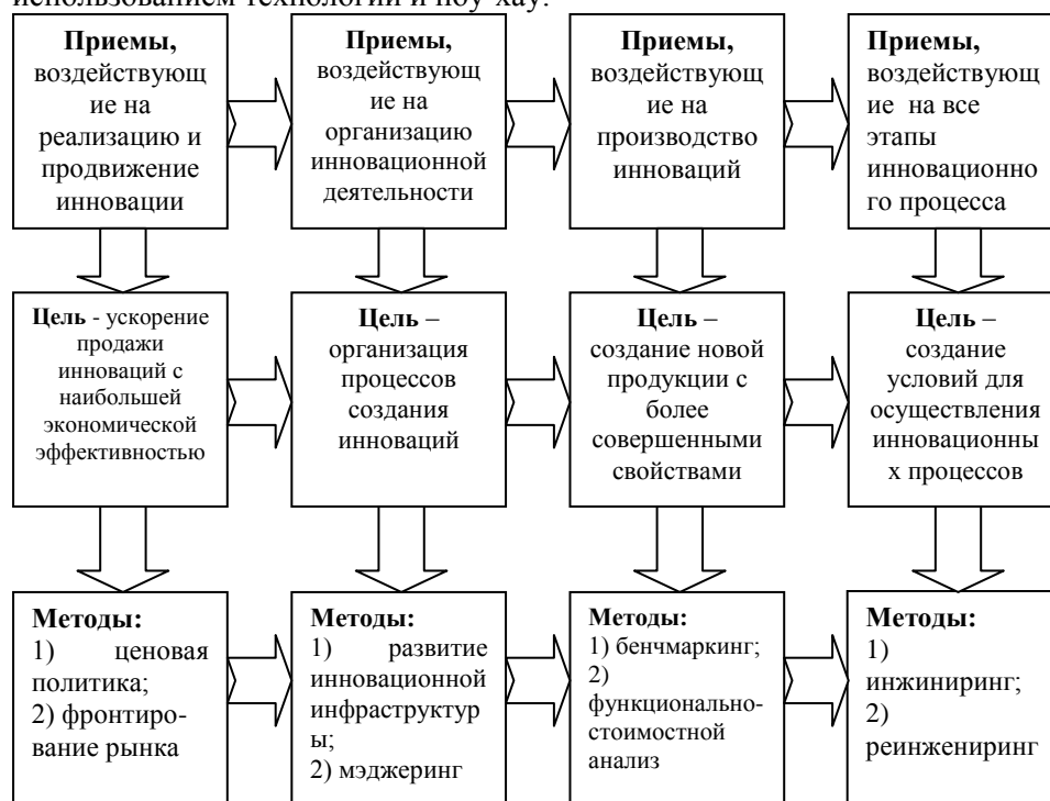
Р и с .3. Приемы и методы осуществления инновационной деятельности

В-десятых, при осуществлении инновационной деятельности предприятия ориентируются на широкий спектр инвестиционных возможностей, начиная от прямого финансирования и заканчивая использованием технологий и ноу-хау.