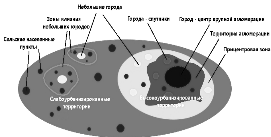
Р и с. 2. Схема расположения слабоурбанизированных территорий

ности. Они включают в себя не только сельские населенные пункты, но и системы расселения, складывающиеся вокруг небольших городов и пгт, выполняющих функции местных центров.