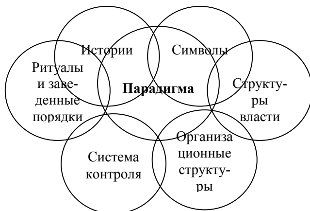
Р и с . 3. Культурная паутину [1, с. 360]

Пытаясь проиллюстрировать сложности стратегического менеджмента в культурном контексте, Джонсон и Скоулз [7] заявляют, что организационная система взглядов, «способ видеть», включена в культурную паутину, сочетающую в себе как «жесткие» структурные и системные характеристики организаций, так и «мягкие» символические черты (рис. 3). Таким образом культурная паутину пытается интегрировать в себе разные концептуальные подходы к пониманию корпоративной культуры.