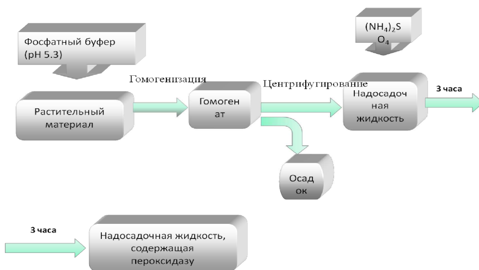
Р и с . 1. Схема выделения и очистки пероксидазы из биоматериала печеночницы благородной ( Hepatica nobilis ) по методу В.Д. Анисимова и Т.Б. Кастальевой (1978)

Метод биуретовой реакции. Готовят биуретовый реактив, растворяя последовательно в мерной колбе на 250 мл 0,375 г \text{CuSO}_4 \cdot 5\text{H}_2\text{O} и 1,5 г сегнетовой соли ( \text{KCOOC-CHON-COONa} \cdot 4 \text{H}_2\text{O} ) в 150 мл воды. Приливают медленно при постоянном перемешивании 75 мг 10%-ного раствора гидроксида натрия и доводят содержимое до 250 мл водой. Биуретовый реактив не подлежит длительному хранению в стеклянной посуде.