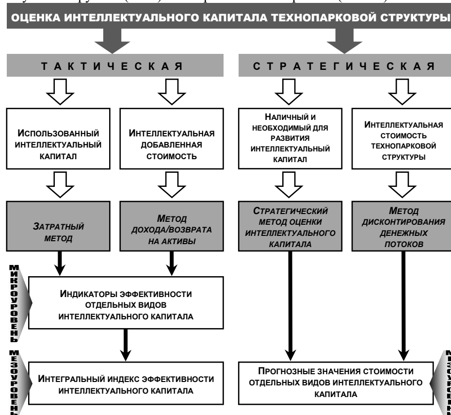
Р и с . 1. Обобщенная модель оценки интеллектуального капитала технопарковой структуры

стоимости за отчетный период (VA), которая рассчитывается как разница между совокупной выручкой (OUT) и материальными затратами (INPUT).