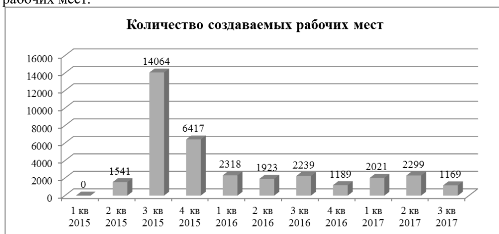
Р и с . 3. Количество создаваемых рабочих мест [7].

В целом за 2015–2016 гг. создано более 9000 новых рабочих мест, в т. ч: в 2015 г. – 2604; в 2016 г. – 6400 (рис. 3). Планируется создание 35908 новых рабочих мест.