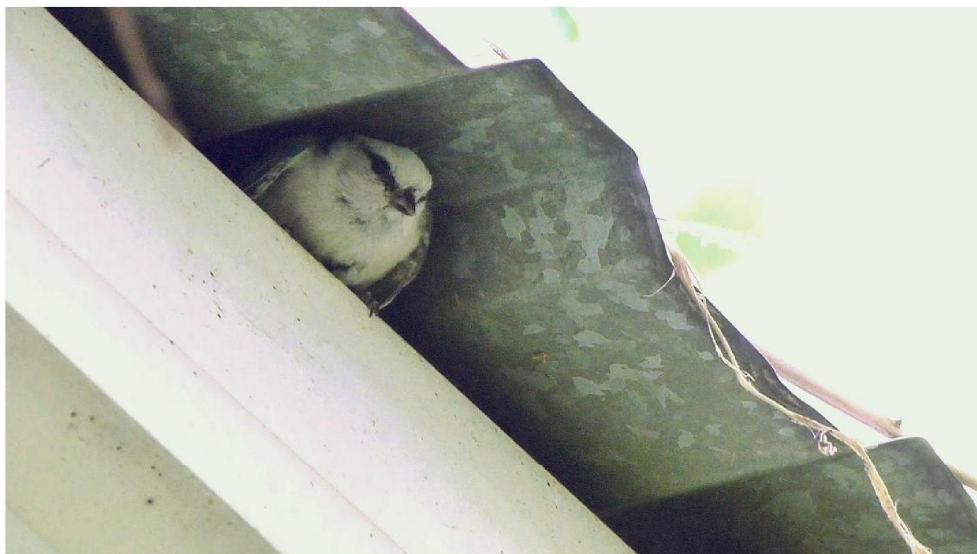
Р и с . 2 . Белая лазоревка у гнезда. 17 июня 2017 г. (по Виноградов и др., 2017).

Скучные факты о вероятном гнездовании князька на территории нынешней Тверской области касались до настоящего времени лишь встреч выводков. К.Н. Давыдов (1896) 15 июня 1895 г. «впервые встретился с выводком князьков около д. Воскресенского на берегу реки Городни». 14 августа 1896 г. ему «еще раз удалось наблюдать выводок Cyanistes cyanus близ села Благовещенья в густом березняке, причем старого самца посчастливилось добыть». Выводок из 8 птиц был встречен 26 июня 1988 г. в низовьях рр. Шоши и Ламы и их притоков в границах Государственного госкомплекса «Завидово» (Николаев, 1998).