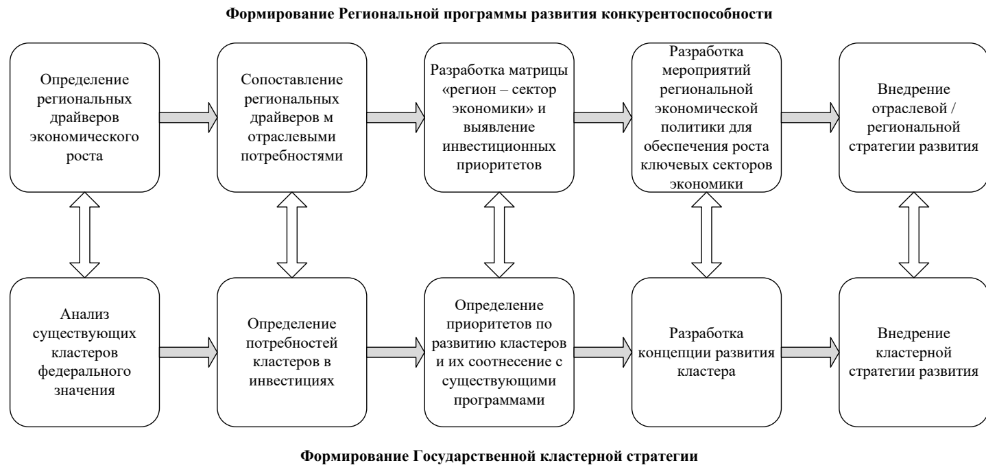
Р и с . 2. Взаимосвязь инициатив на региональном и федеральном уровнях