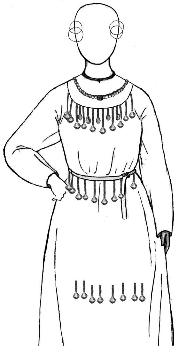
Рис. 2. Реконструкция женского погребального костюма по материалам раскопок кургана № 6 могильника Устье (Тверская обл). Рисунок автора.

Использование раковин каури в костюме и в качестве оберегов имеет широкую хронологию и географию. Каури широко использовались в костюме населения Древней Руси и соседних территорий (Например, находки из погребений у с. Броварки, Каменное, в Гродно и др.). В научной литературе каури рассматриваются как символы плодородия, женственности, рождения, как апотропеический амулет, предназначенный для оберегания от сглаза 24 , а также как символ, связанный с христианством 25 .