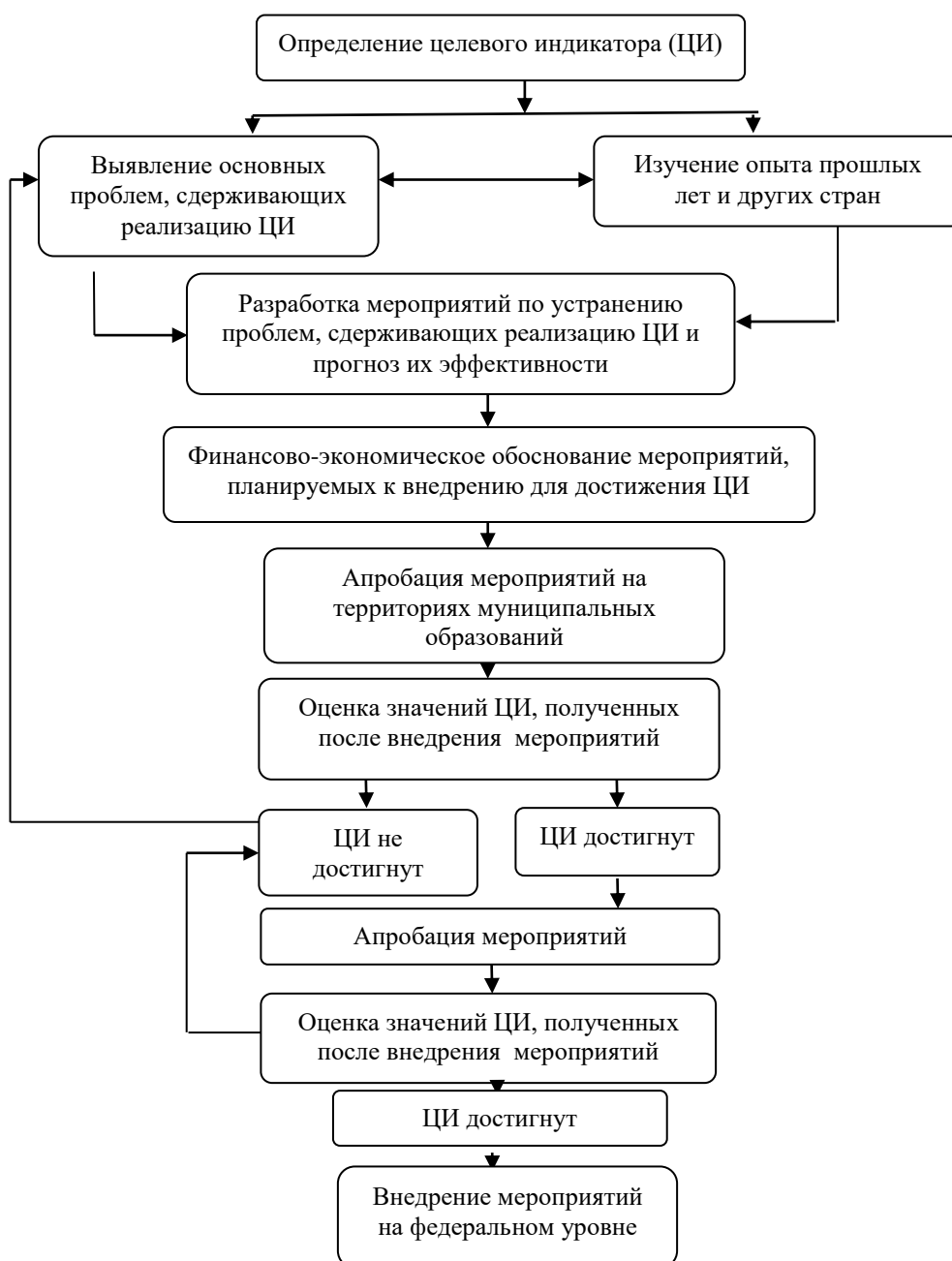
Рис. 1. Алгоритм разработки и внедрения мероприятий по развитию малого и среднего бизнеса аграрной сферы (составлено автором по материалам исследования)

основные этапы, которые малый и средний аграрный бизнес должен учесть при переориентации на производство экологически безопасной продукции.