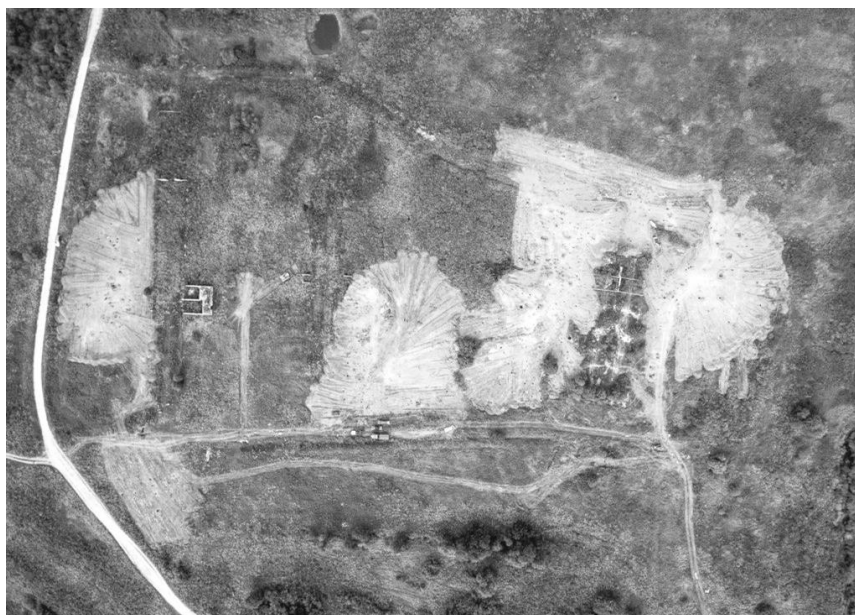
а) поисковые работы в сентябре 2018 г., фото