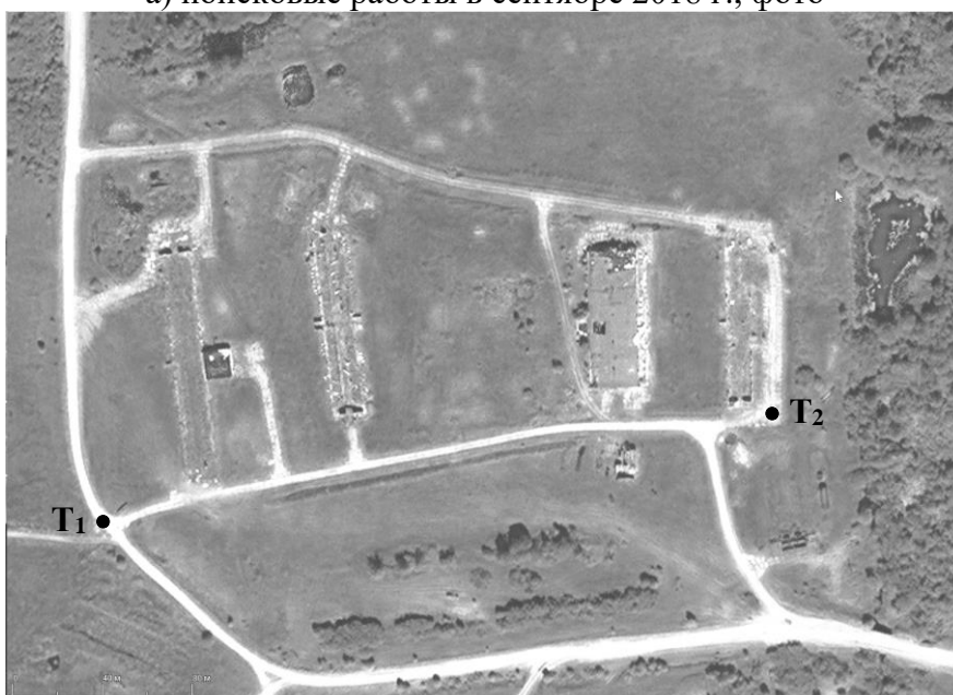
б) космический снимок Bing , расстояние от T 1 до T 2 300 м. Р и с. 4. Хозяйственная зона на северной окраине д. Полунино

В погребальной книге 46 гв. сп [25] отмечены следующие захоронения у д. Полунино неустановленных бойцов (22.8 – 47, 23.8 – 52, 24.8 – 43, 2.9 – 19, 18). Вероятно, захоронения военной командой производились после освобождения д. Полунино 19.8.