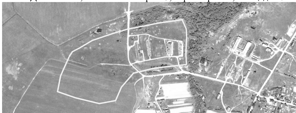
Р и с. 3. Схематичное положение 16 гв. сд с 30.7.1942 г. по 14.8.1942 г.

Для области, показанной на рис. 3, периметр 2 км, площадь 20 га.